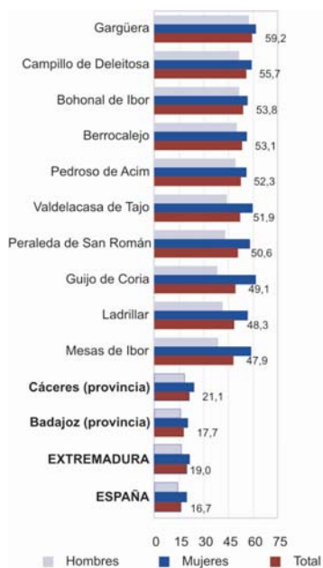
Gráfico 1. Municipios con mayor porcentaje de población de 65 años y más. 2007. Porcentaje