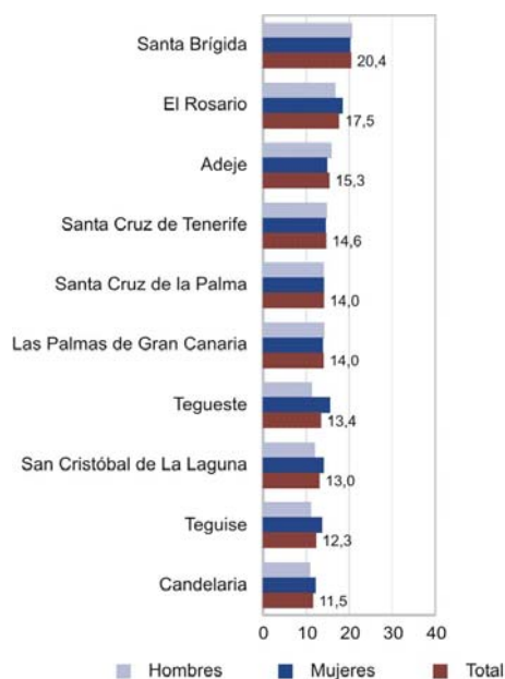
Gráfico 1. Municipios con mayor población con estudios superiores. 2001. Porcentaje