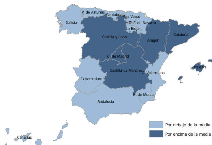
Mapa 1. Esperanza de vida al nacer. Comunidades Autónomas. 2008