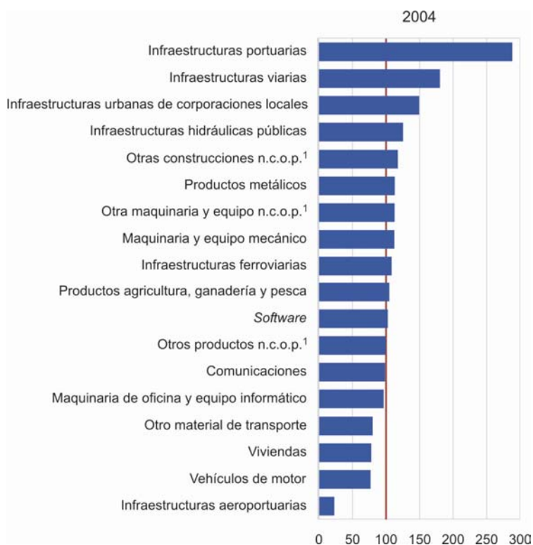
Gráfico 2. Comparación de la estructura del capital neto nominal de Asturias respecto a España. España=100