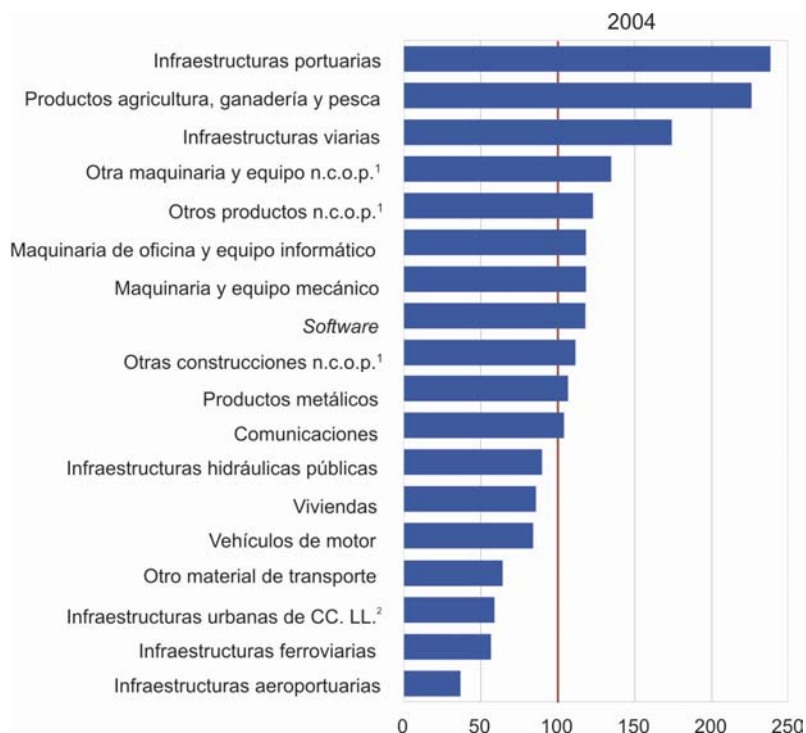
Gráfico 2. Comparación de la estructura del capital neto nominal de Galicia respecto a España. España=100